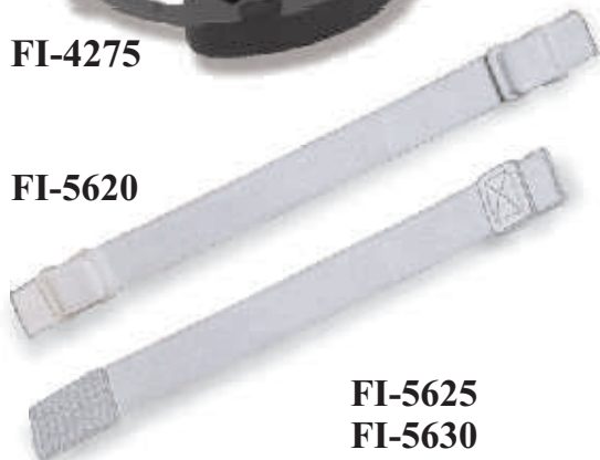
FI-5625 FI-5630 FI-5635